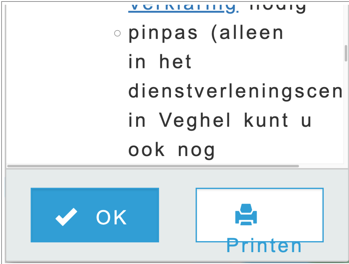
Afspraak maken - Letters verdwijnen buiten beeld 400% zoom

In dit hoofdstuk staan screenshots die tijdens het onderzoek zijn gemaakt, maar die niet bij een specifiek succescriterium horen.