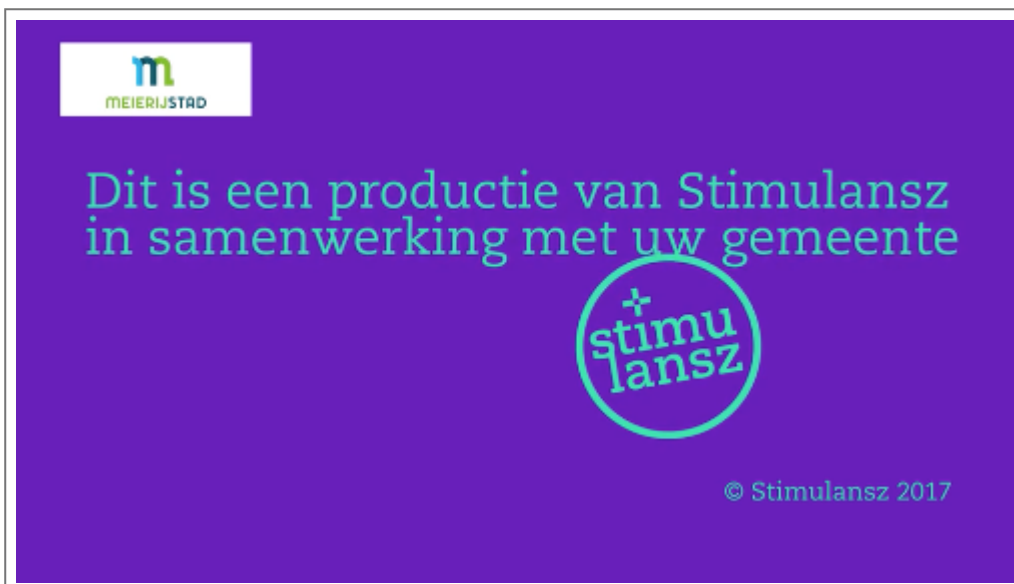
Eindbeeld video over schulden