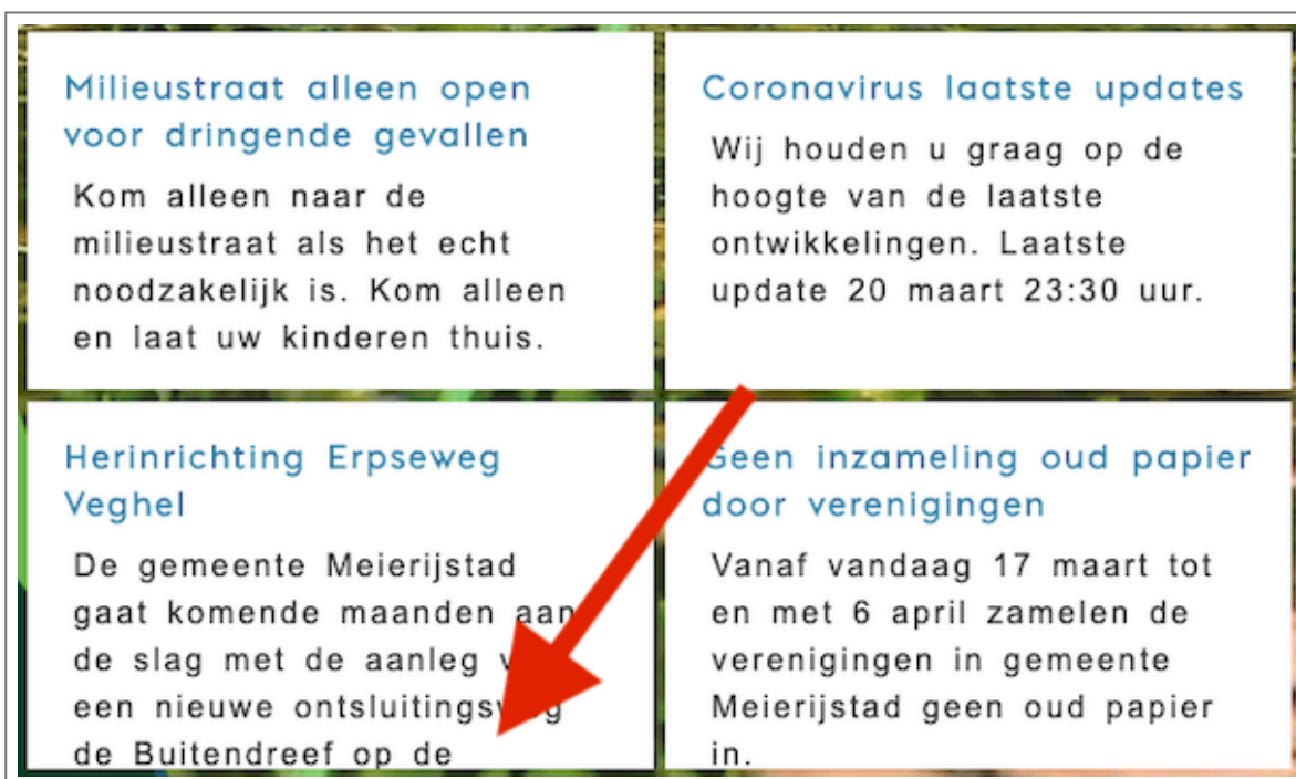
Text spacing nieuwsberichten