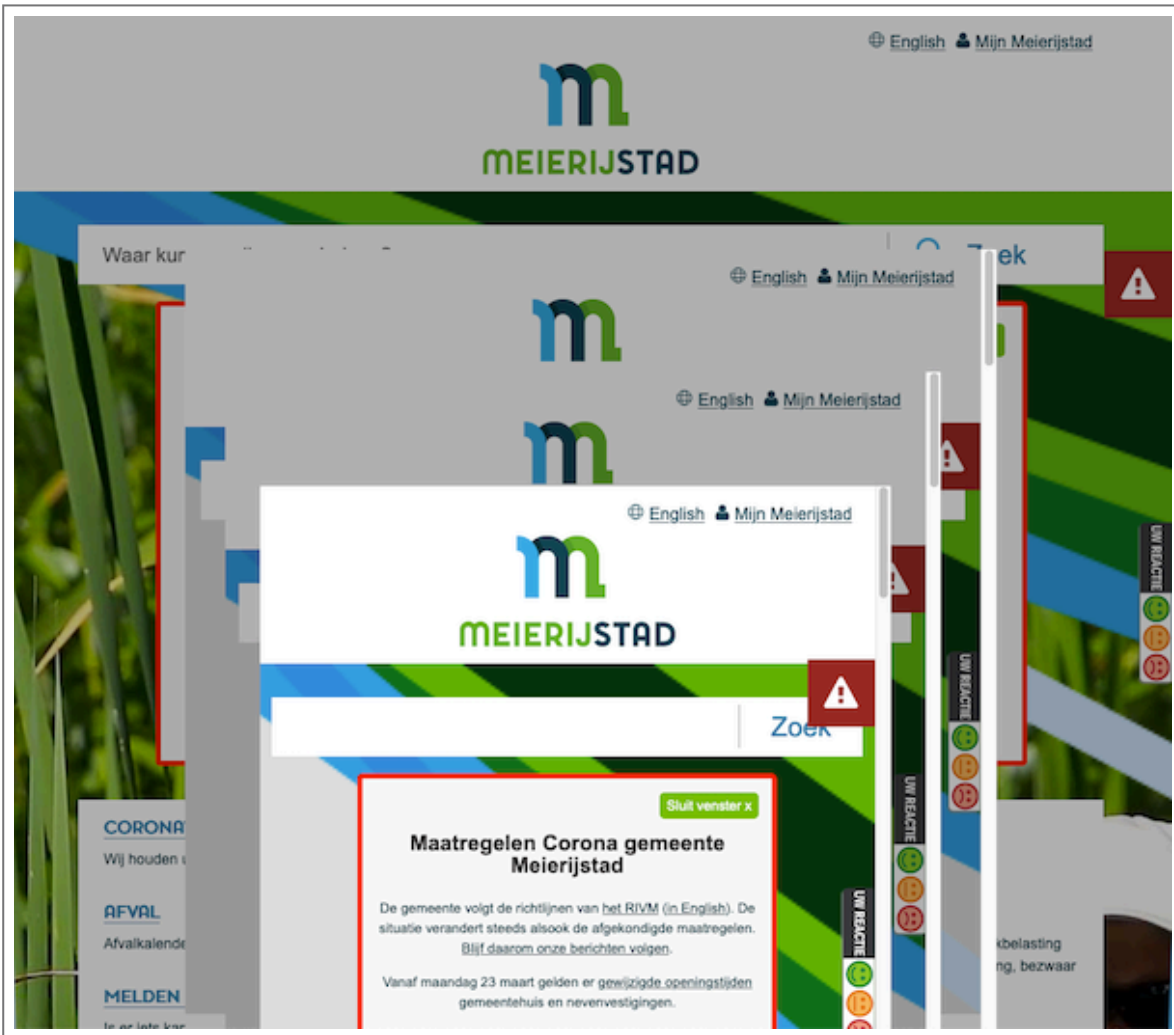
Scherm in scherm bij feedbackformulier